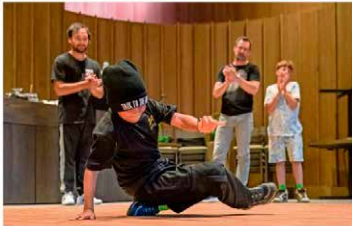
De museumzalen van Singer Laren zijn vrijdagavond het decor van urban arts zoals dans, rap en spoken word performances.

'Nachtblik', Dynamic Arts en Singer Laren, 22 augustus, Singer Laren, 19.00-22.00 uur Tickets via singelaren.nl