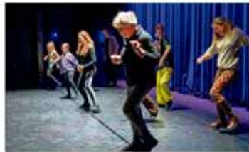
Jong en oud geniet van het programma.