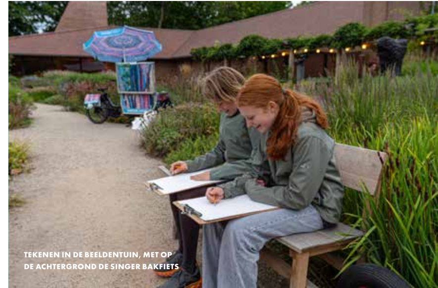
TEKENEN IN DE BEELDENTUIN, MET OP DE ACHTERGROND DE SINGER BAKFIETS

‘Het is erg leuk om naar kunst te kijken met kinderen. Ze zijn heel erg bereid een andere bril op te zetten als je de juiste vragen stelt. Ik ben geïnspireerd geraakt om vaker met de klas naar kunst te kijken.’ Reactie leerkracht groep 5 na museumbezoek via Kunst Centraal