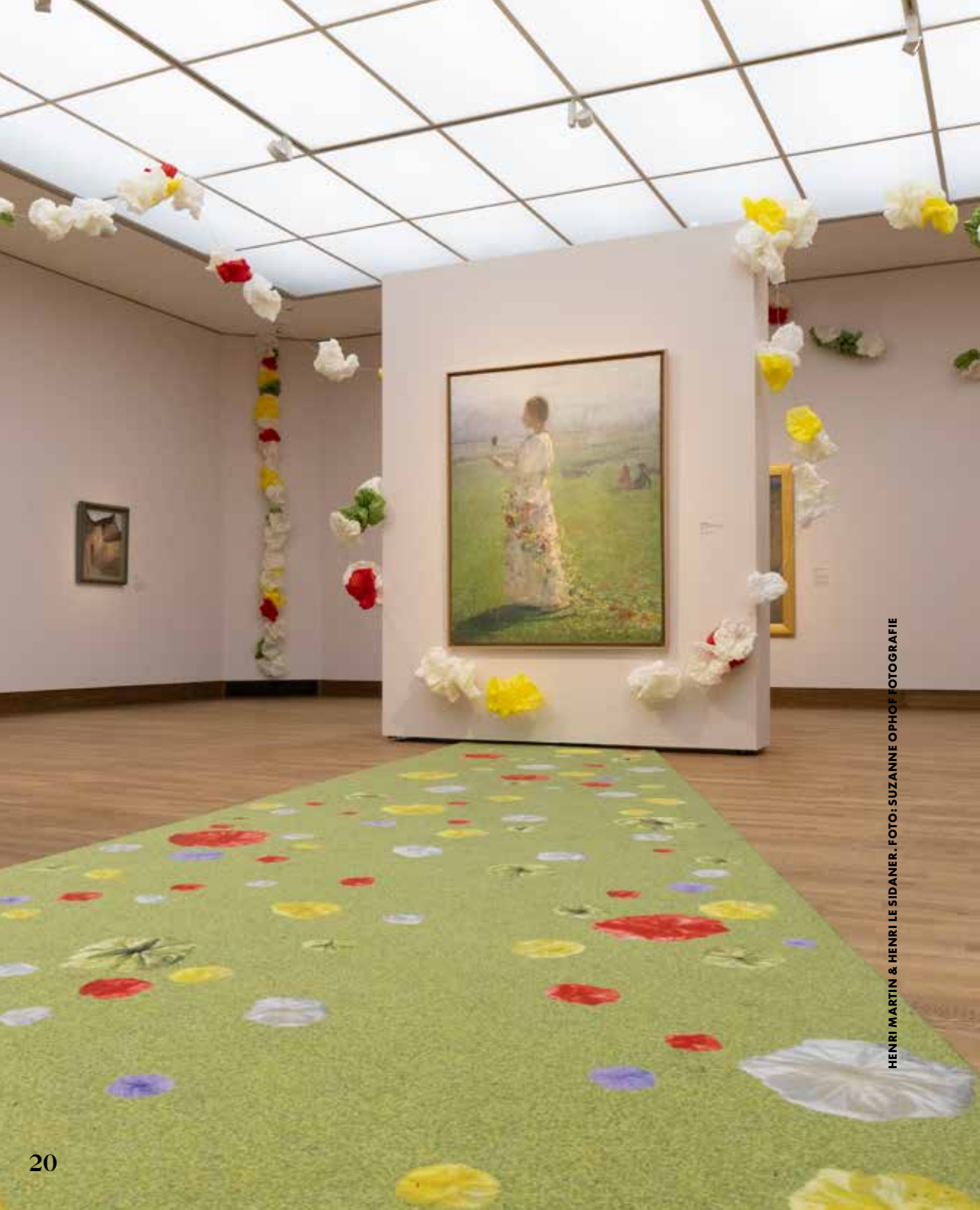
HENRI MARTIN & HENRI LE SIDANER.