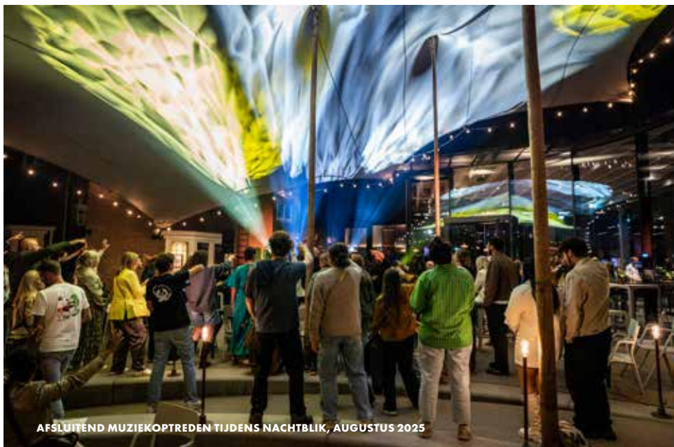
AFSLUITEND MUZIEKOPTREDEN TIJDENS NACHTBLIK, AUGUSTUS 2025