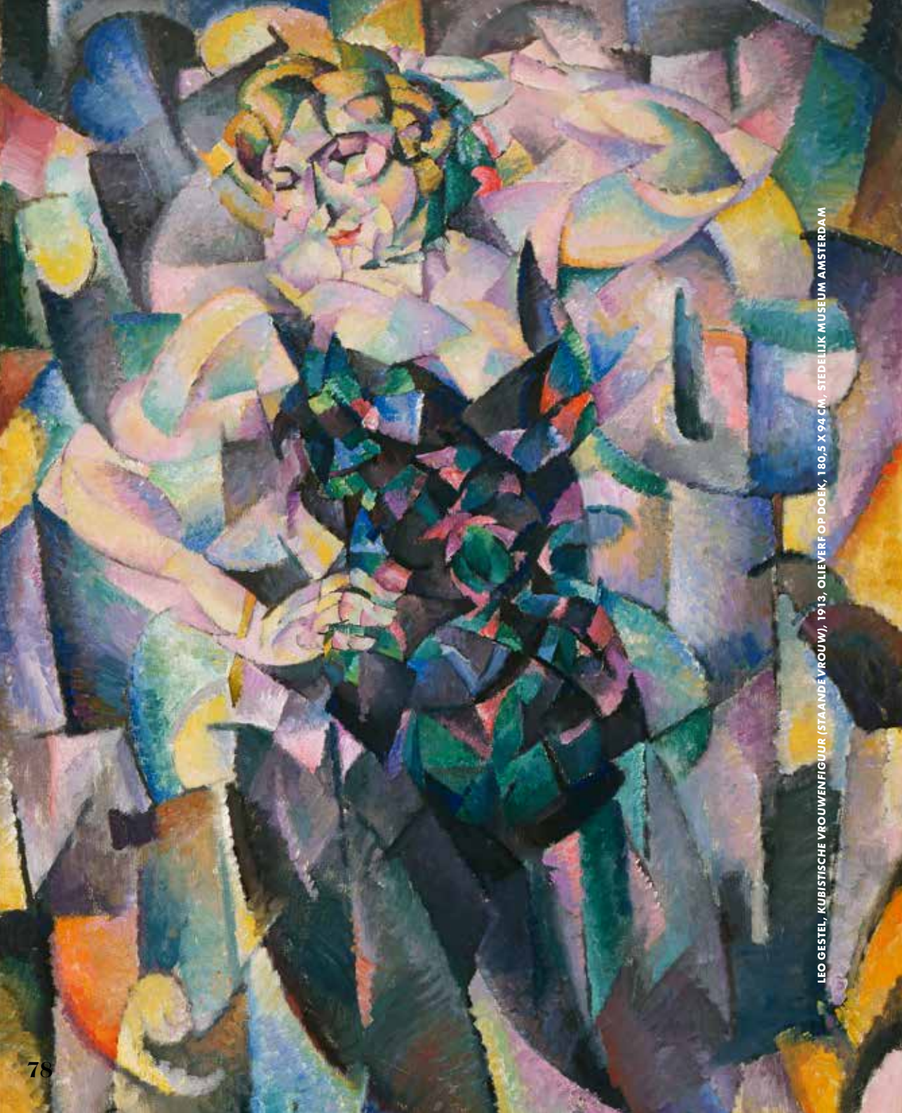
LEO GESTEL, KUBISTISCHE VROUWENFIGUUR (STAANDE VROUW), 1913, OLIEVEEF OP DOEK, 180,5 X 94 CM, STEDELIJK MUSEUM AMSTERDAM