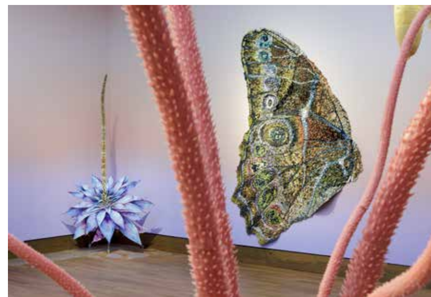
WIJ ZIJN NATUUR.

2025 is een jaar zonder grote verbouwingen, maar staat vooral in het teken van het optimaliseren van ons gebouw. Energiebeheer vormt hierin een belangrijk aandachtspunt. Ondanks de sterk gestegen inkooprijzen voor energie lukt het ons om de totale energiekosten de afgelopen jaren stabiel te houden.