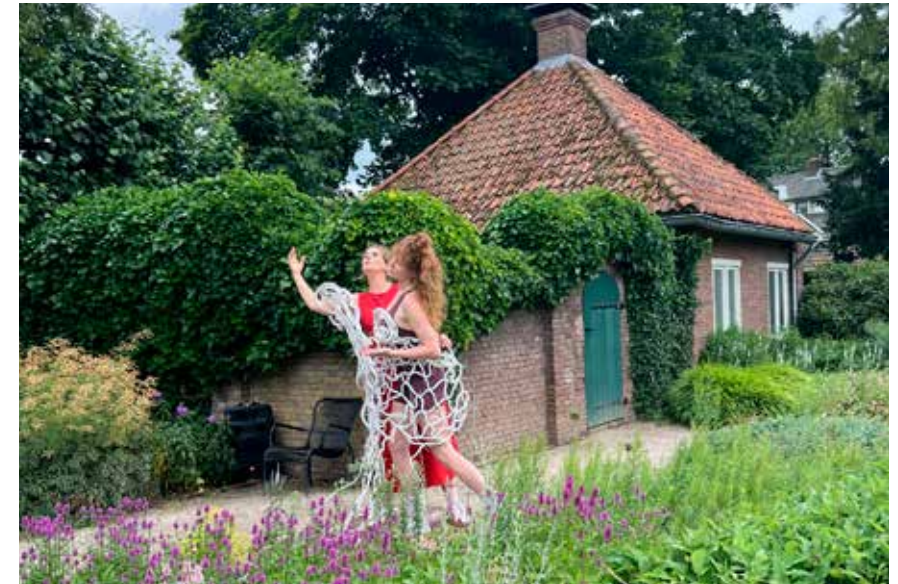
LUNCHTHEATER LILITH, DE WILDE VROUW.