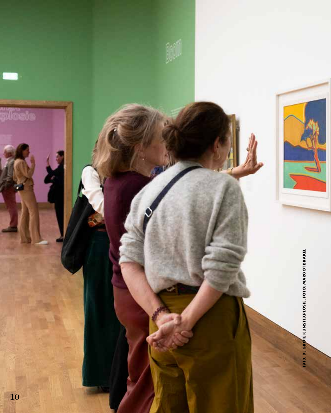
1913. DE GROTE KUNSTEXPLOSIE.