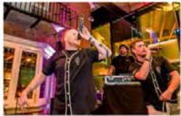
De vorige zomereditie waren een groot succes.

over de voortgang van het evenement. „Maar als je zegt dat in jouw museum iedereen welkom is, dan mag dat geen leze kreet zijn. Dan moet je er voor zorgen, dat er voor iedereen, dat evenszinnig voor de jongere doelgroepen, iets te doen is. Er wordt altijd gevraagd naar oplossingen. Echter, nieuwe initiatieven hebben tijd nodig. Toen we begonnen met de publicatie van de resultaten, bijvoorbeeld, kwam er niemand. Nu is dat elke keer weer een succes.“