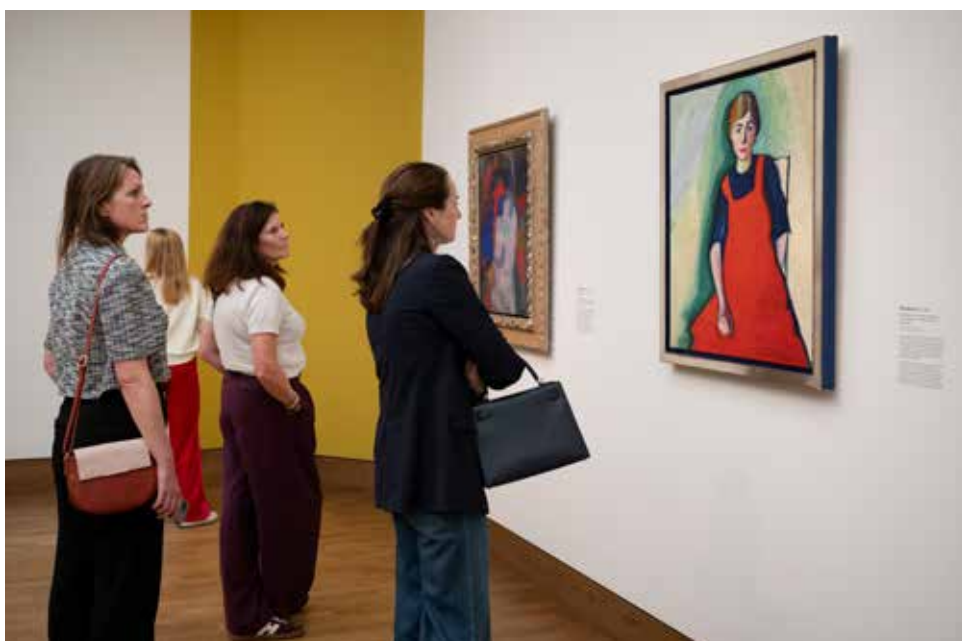
BOVEN: HENRI MARTIN & HENRI LE SIDANER. ONDER: 1913. DE GROTE KUNSTEXPLOSIË.