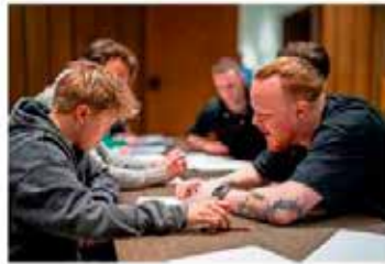
'Nachtblik' is een samenwerking met Dynamic Arts, dat bestaat uit jonge kunstenaars.

's Avonds is er een andere dynamiek, een andere sfeer, een die jongeren aansprekt, zo is de ge-