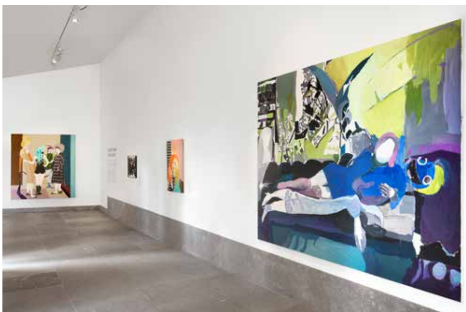
BOVEN: ROND DE HUT VAN MONDRIAAN. ONDER: SCHERPE TONGEN. HOOGTEPUNTEN UIT DE ABN AMRO-KUNSTCOLLECTIE.