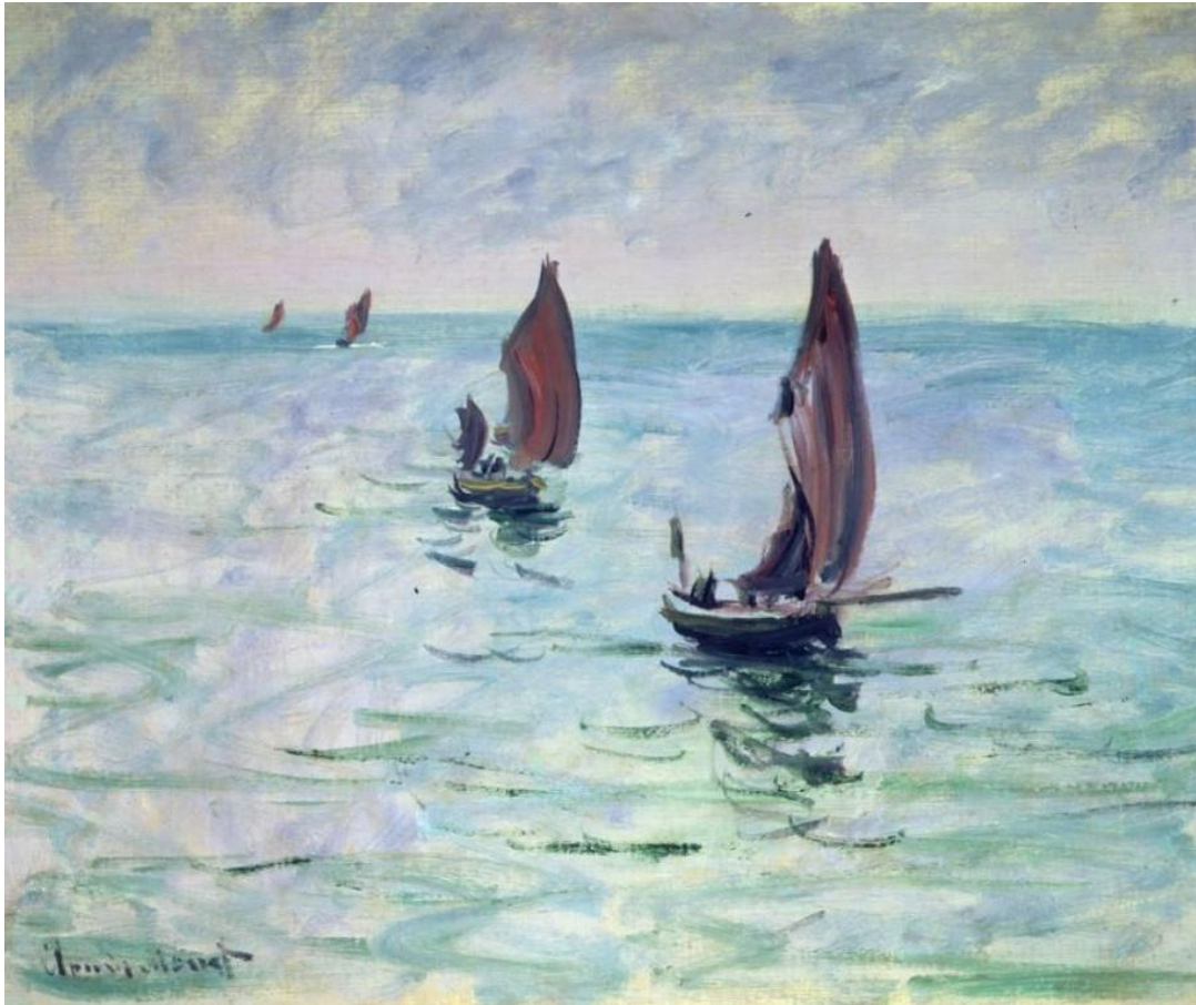
Claude Monet, Bateaux de pêche, 1885, olieverf op doek, 50 x 62 cm.. Naast dit werk zijn nog drie andere werken van Monet in de tentoonstelling te zien.

Amsterdamse Rijksmuseum te zien. Het is voor de eerste keer dat nu een nieuwe selectie van de impressionisten en postimpressionisten uit hun collectie te zien is. Het publiek kan kennismaken met een deel van de verzameling dat zich beweegt tussen de zeegezichten van Monet en de betoverende bloemaquarellen van Nolde.