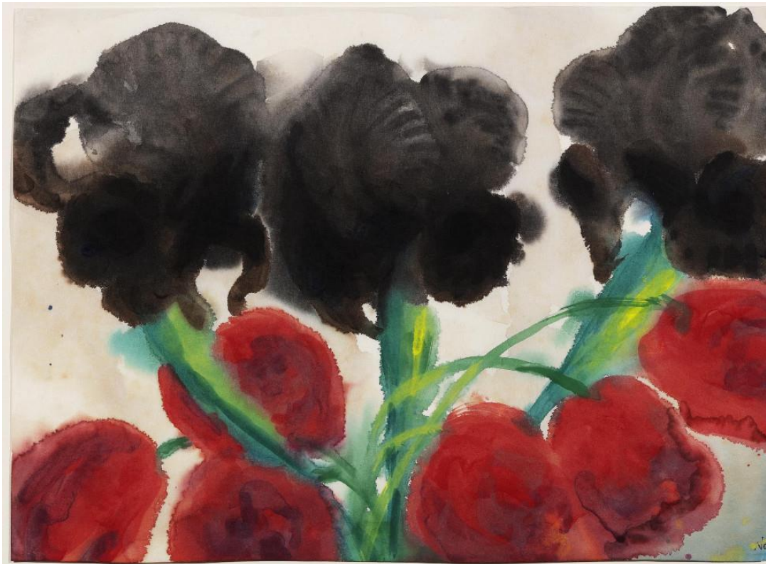
Emil Nolde, Bloemen (Zwarte dahlia's en papaver) , 1934, waterverf op Japans papier, 34 x 47,7 cm