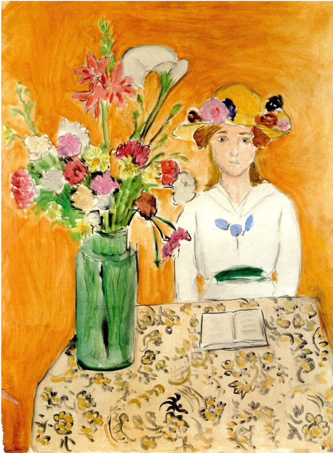
Henri Matisse, La Fille en blanc et le bouquet, 1919, olieverf op doek, 65,5 x 50,5 cm