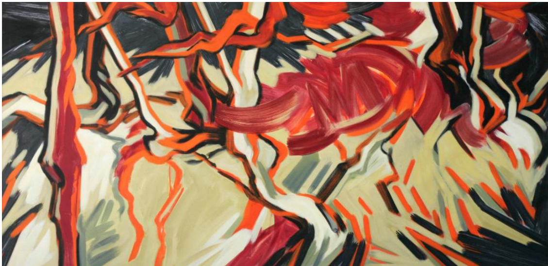
Robert Zandvliet, Zonder titel , 1999, tempera op linnen, 201 x 401 cm, Collectie AkzoNobel Art Foundation

Tegelijkertijd is in een van de tuinzalen van het museum een installatie te zien van de winnaars van de derde editie van de curatorenprijs VBCN OPEN: Mels Evers & H  l  ne Webers. VBCN OPEN stimuleert jonge curatoren door hen een podium te bieden en de kans te geven een tentoonstellingsconcept te realiseren. De VBCN stelt hiervoor zowel de kunstcollecties van de leden als een productiebudget beschikbaar.