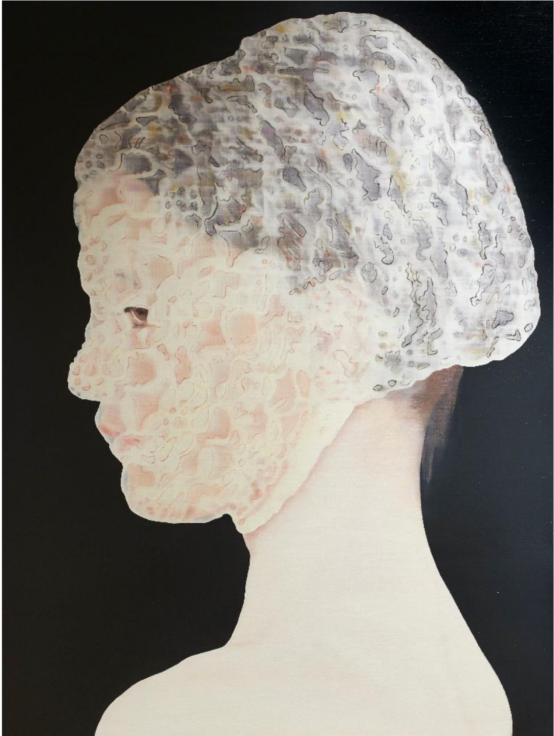
Katinka Lampe, 1216153, olieverf op doek, ca. begin 2015, 160 x 120 cm, Stichting Kunst & Historisch Bezit ASR Nederland, Courtesy Galerie Ron Mandos, Amsterdam