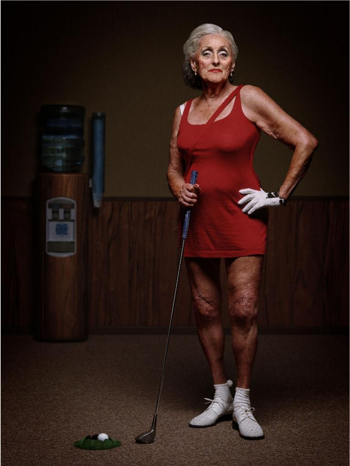
Erwin Olaf, Isabella R. , from the serie Mature (1999), 113 x 84 cm, Lambda Print, framed, courtesy Flatland Gallery, Amsterdam, Collectie ministerie van Buitenlandse Zaken