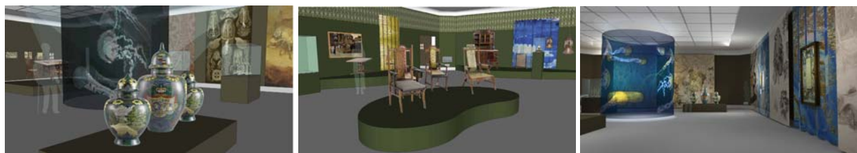
Impressie van het tentoonstellingsontwerp (ontwerp Maarten Spruyt en Tsur Reshef)

Al bijna 50 jaar verzamelt het Rijksmuseum decoratieve kunst uit de periode 1890-1920. Deze topcollectie is echter al geruime tijd niet geëxposeerd. Een aantal objecten en ensembles is zelfs nog nooit aan het publiek getoond. Singer Laren is dan ook verheugd om de tentoonstelling Art Nouveau uit het Rijksmuseum te kunnen presenteren.